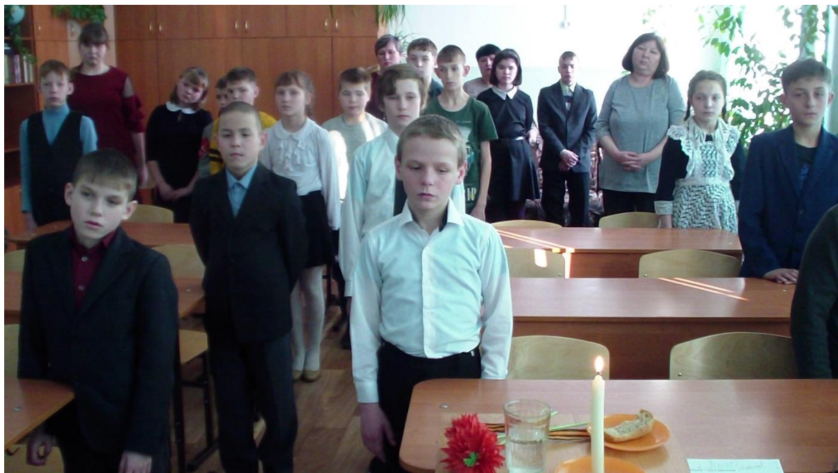
Рис.3. Минута молчания

Учитель: Давайте встанем, помолчим, почтим героев Ленинграда. Всех тех, чьи жизни унесла в суровый час блокада. Объявляю минуту молчания (звук метронома аудиозапись).