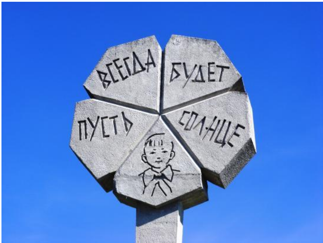
Рис.5. Памятник цветок жизни. Изображение на слайде.

Вы с родителями рисовали берёзки — символ России. Сегодня дома дорисуйте на ствол каждой березки красный треугольник, в память о страшных блокадных днях Ленинграда.