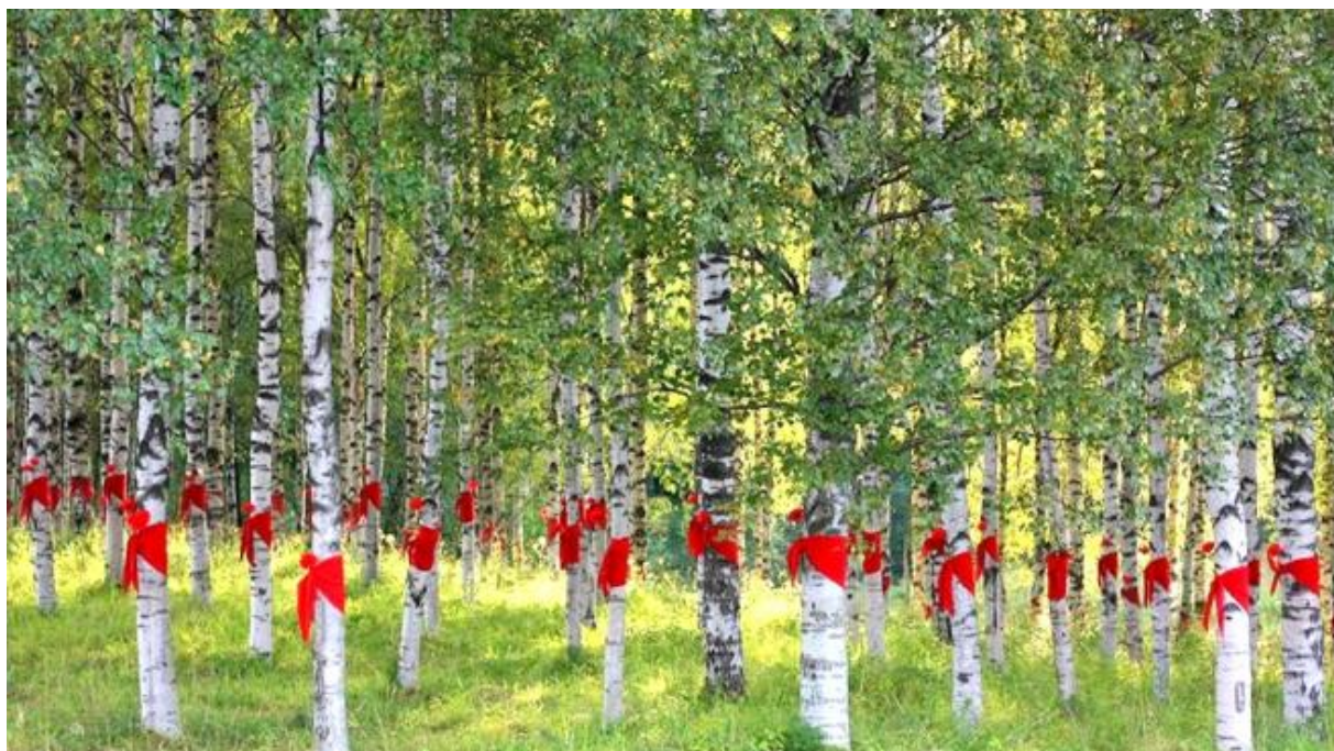
Рис.4. 900 берез. Изображение на слайде.

Учитель: По дороге из Санкт-Петербурга к Ладожскому озеру есть необычная берёзовая роща. Памятная роща, где высажено 900